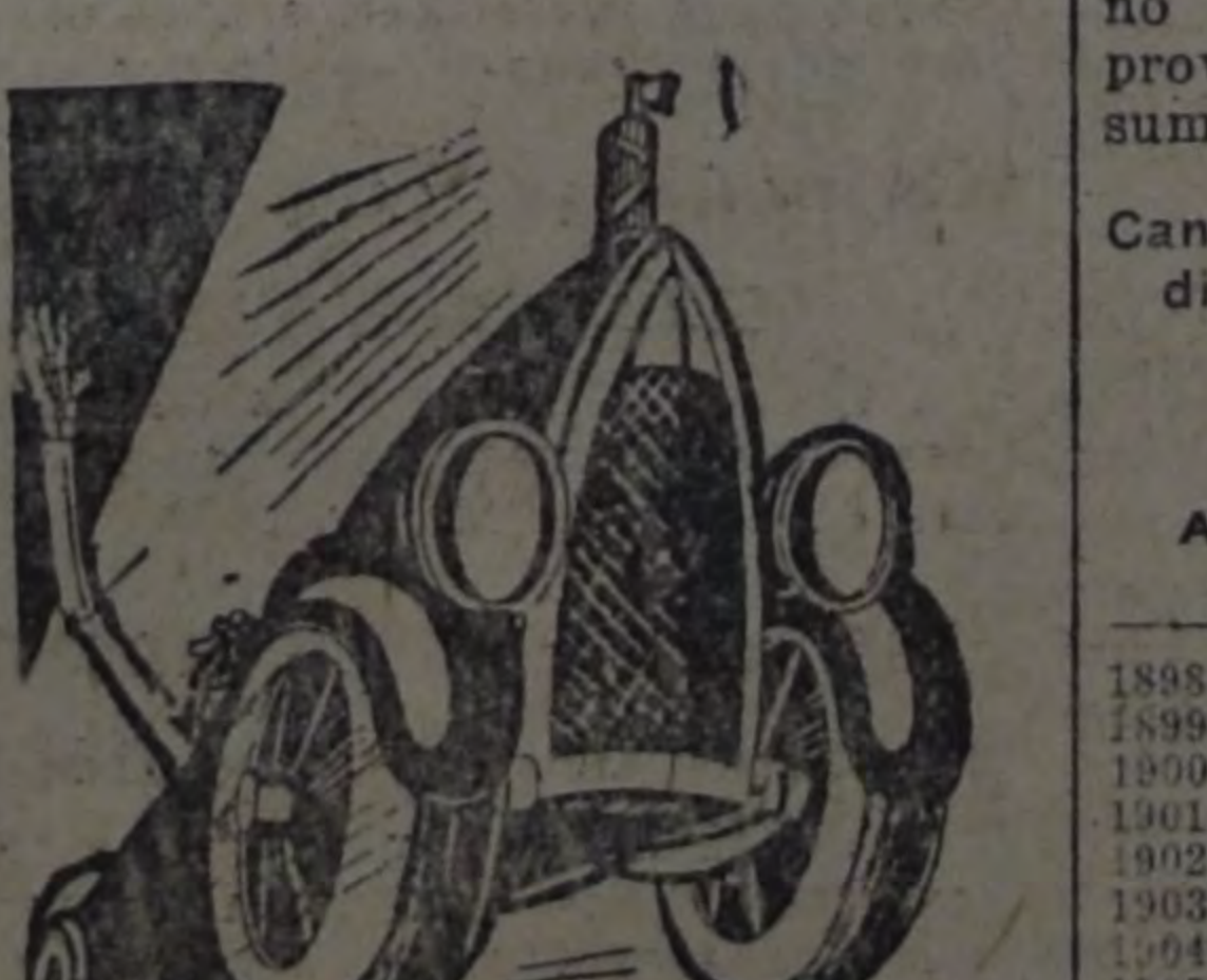
LA MUESTRA TENTATIVA

—Desearía collararme hacia... el final inexorable, pero algo me detiene. (Mussolini es detenido por un grupo, indignadamente le da del resaca, que así se collar de la Annullata.)