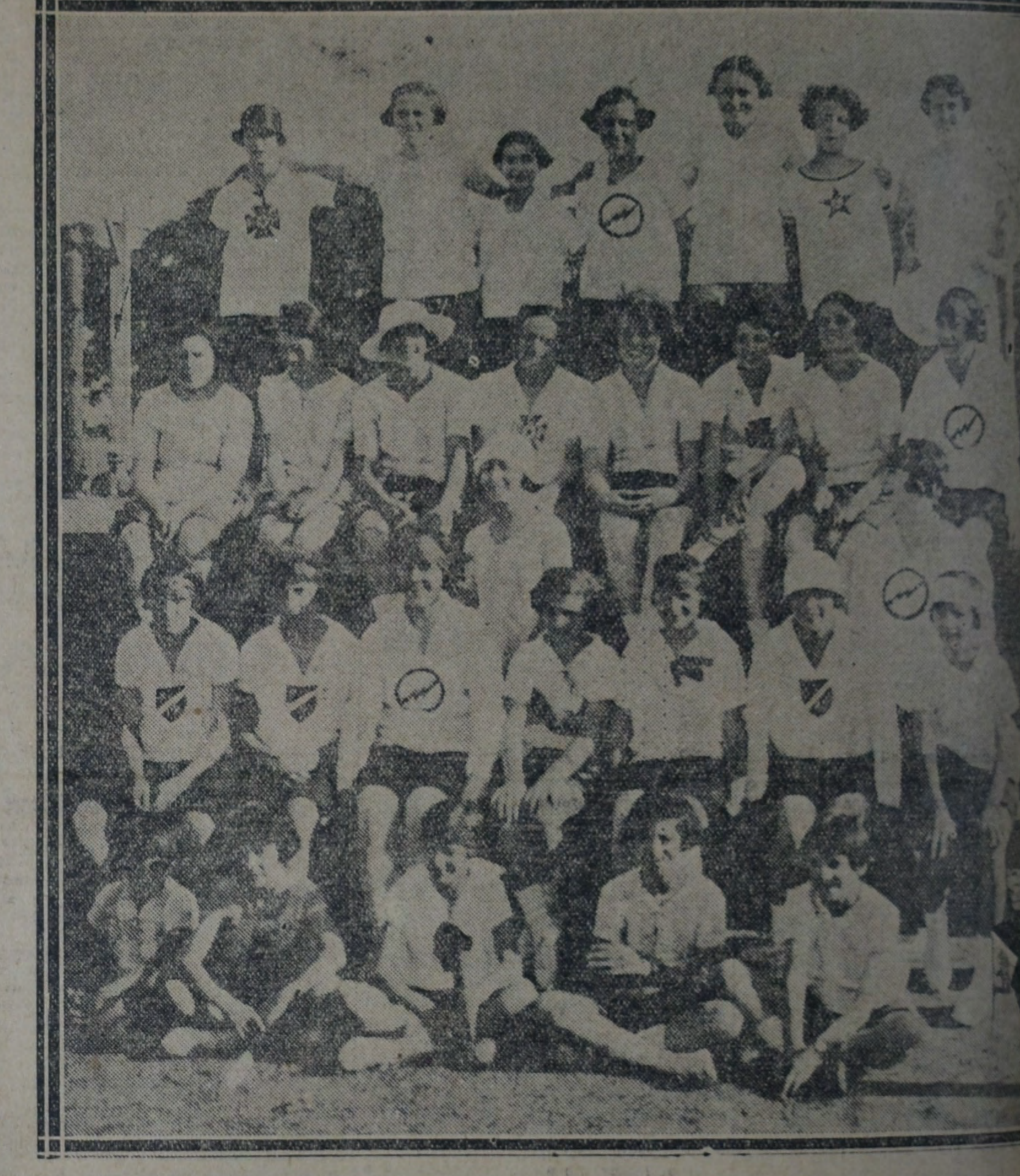
EL CONJUNTO DE ATLETAS QUE DISPUTÓ LAS DIVERSAS PRUEBAS DEL PROGRAMA

La carrera de postas de 300 mts. (4 x 75) impacientemente esperada por el público, logró despertar verdadera emoción en su desarrollo. Intervinieron en esta prueba dos equipos: Rácing Club y uno del C. A. F. Alfa. Al disparo sallieron