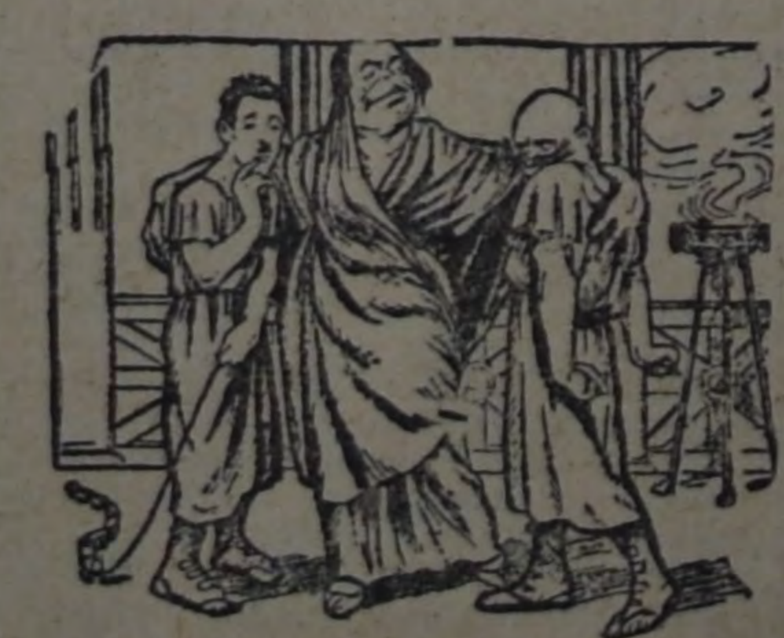
LA MADRE DE LOS GRANDES

—Estas son mis joyas. (Las "joyas" son el "Paraná", el "Cerro de Cerro", y el "Veche", el gobernador de Somellana, que fué retirado últimamente como demisado irresponsable para ocupar el cargo. Son dos de los fascistas más furiosos.)